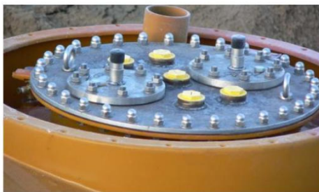
DN600 hooldusluuk raamiga hoolduskaevu kinnitamiseks.

Pakume mahutitele lisavarustust, nt. redelid, platvormid, platvormid pumpadele, piirded, erinevad liited, varjud, katused jne.