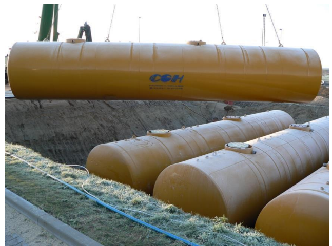
4 x 100 m 3 kaheseinalised maa-alused mahutid