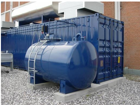
5 m 3 mahuti diameetriga 1600 mm

Pakume mahutitele lisavarustust, nt. redelid, platvormid, platvormid pumpadele, piirded, erinevad liited, varjud, katused jne.