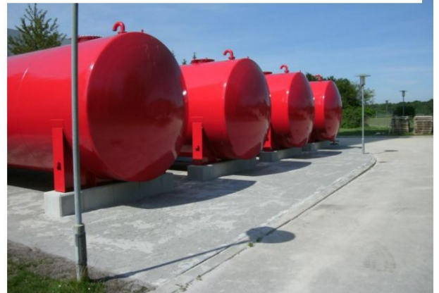
4 x 100 m 3 mahutid diameetriga 2900mm