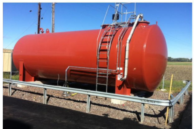
50 m 3 mahuti diameetriga 2900 mm. Redel ja platvorm mahutil. Täitmine maapinnalt.